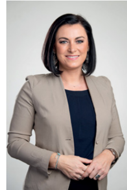
Bundesministerin Elisabeth Köstinger

Drei von vier Österreicherinnen und Österreichern wünschen sich eine Ausweitung des Angebots an regionalen Lebensmitteln. Wer regional kauft, stärkt bäuerliche Familienbetriebe, schützt die Umwelt durch kürzere Transportwege und sorgt dafür, dass die Wertschöpfung erhalten bleibt. Der Bund geht daher mit gutem Beispiel voran und will mit der Initiative „Österreich isst regional“ aufzeigen, wie der Einkauf gestaltet werden kann. Ziel laut Regierungsprogramm ist die 100-prozentige regionale und saisonale öffentliche Beschaffung bei Lebensmitteln mit Erhöhung des Bio-Anteils.