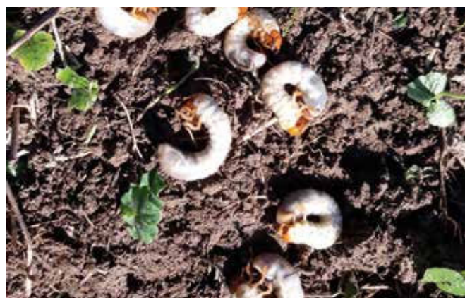
Die Maikäfer-Engerlinge fressen alle Wurzeln bis zur Bodenoberfläche weg.

Als Engerlinge werden Larven von Mai-, Juni- und Gartenlaubkäfern bezeichnet. Nach der Paarung legen die Käfer ihre Eier im Boden ab, die sich daraus entwickelnden Larven fressen dann die Wurzeln der Gräser ab. In der Kombination mit Trockenperioden, wie sie gerade 2018 und 2019 aufgetreten sind, führt ein vermehrtes bis massenhaftes Auftreten der Engerlinge zur Zerstörung von Grünland. Im Raum der EUREGIO Salzburg - Berchtesgadener Land - Traunstein ist diese Problematik mehrfach und sehr intensiv aufgetreten, etwa im Pinzgauer Heutal, im Ortsteil Jochberg in der bayerischen Gemeinde Schneizlreuth oder auch im Flachgau am Südufer des Wolfgangsees. Somit Grund genug für die EUREGIO, diese Problematik Anfang September in Freilassing in einem grenzüberschreitenden Fachaustausch, ausgehend von der EUREGIO-Facharbeitsgruppe Land- b./w.