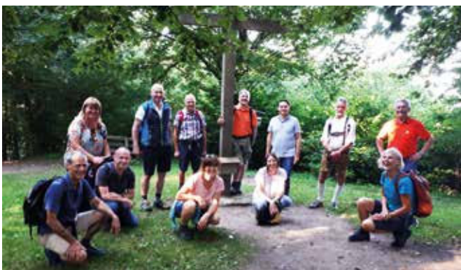
Beim Gipfelkreuz des Buchbergs (803 m) in Mattsee mit EUREGIO-Präsident Konrad Schupfner (hinten rechts).

Bereits zum 17. Mal fand im September der EUREGIO-Bürgermeisterausflug statt. Eine Wanderung auf den Buchberg bei Mattsee (auch Etappenziel auf der von der EU über INTERREG geförderten slow-bike-tour ( www.slow-bike-tour.com ) und