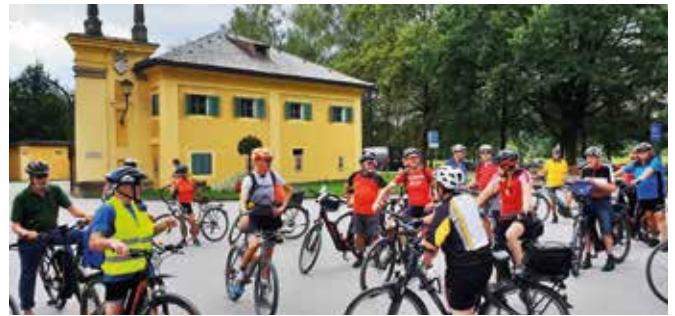
Wunderschöne Radwege, zahlreiche Naturjuwelle der Region und Zwischenstopps bei Sehenswürdigkeiten sowie viele genüssliche Highlights standen bei der 5. EUREGIO Genuss-Radtour auf dem Programm.

43 Teilnehmerinnen und Teilnehmer trotzten bei der bereits 5. Auflage der EUREGIO Genuss-Radtour vom 28. bis 30. August 2020 dem Wetter. Professionelle Radguides, ein Radservicetechniker und ein Begleitfahrzeug (mit Getränken, Riegeln, Powergels etc.) bildeten die bunte und topmotivierte Truppe der Tour. Grenzüberschreitend wurden – mit Start- und Zielpunkt am Sportzentrum Rif – im Salzburger Land mit dem Trumer Seengebiet und der Salzburger Altstadt mit Festspielbezirk, im Berchtesgadener Land mit einem Abstecher zum Königssee und im Salzburger Tennengau täglich 70 km geradelt. Immer entlang von wunderschönen Radwegen, vorbei an zahlreichen Naturjuwelen der Region mit Zwischenstopps bei Sehenswürdigkeiten und Pausen zur Stärkung.