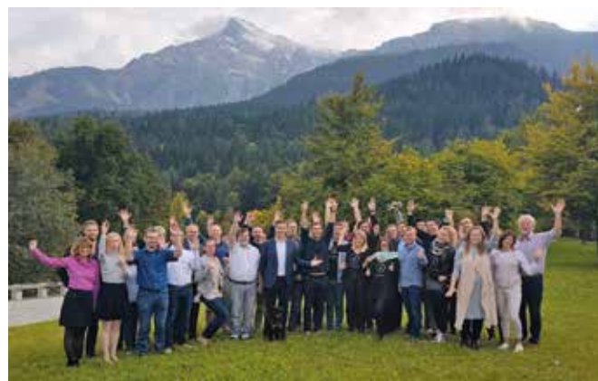
Teilnehmer/-innen beim EuRegio-Startup-Wochenende in Berchtesgaden.

Das Projekt wird von der EU über INTERREG V A Österreich/Bayern gefördert und zielt darauf ab, den Wohn- und Arbeitsstandort für innovationsorientierte Gründer/-innen attraktiv zu machen, auch um im Spannungsfeld zwischen Wien-Linz-München bestehen zu können.