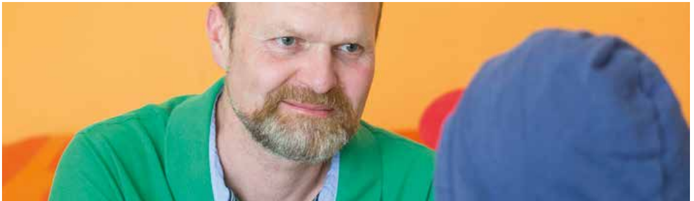
Die Streetworker stehen Jugendlichen mit Rat und Hilfe zur Seite.

Seit zehn Jahren gibt es das Projekt Streetwork Pinzgau. Die Streetworker/-innen der Caritas arbeiten präventiv und suchen die Jugendlichen in ihren Lebenswelten auf, z. B. auf Bahnhöfen und öffentlichen Plätzen, aber auch in Schulen und Jugendtreffs. Durch die aufsuchende Sozialarbeit erreichen sie junge Menschen in schwierigen Lebenslagen frühzeitig und können durch Beratung und Hilfe in vielen Fällen schwerwiegende Folgen nachhaltig verhindern.