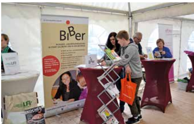
Viele Interessierte ließen sich von den Bildungsexperten beim Tag der Weiterbildung bei Globus in Freilassing beraten.

20 Bildungseinrichtungen aus der EuRegio Salzburg – Berchtesgadener Land – Traunstein präsentierten am 22. September am Globus Markt in Freilassing interessante Angebote aus ihren ak-