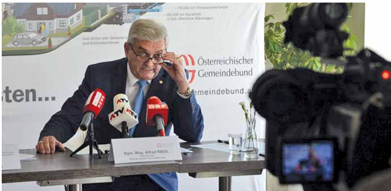
Gemeindebund Präsident Alfred Riedl.

3.11.2017 – Die Gemeinden können die Folgekosten der Abschaffung des Pflegeregresses nicht tragen. Der Gemeindebund startete daher eine Kampagne, in der Gemeinden Resolutionen beschließen sollen. Auch ein neues Wahlrecht stand auf der Agenda des Gemeindebundes.