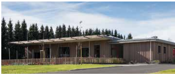
Die Krabbelstube in Neumarkt-Sighartstein wurde in Holzmassivbauweise errichtet.