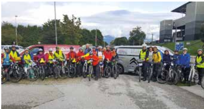
Zahlreiche kulturelle und genüssliche Highlights erlebten die TeilnehmerInnen bei der diesjährigen EuRegio Genuss Radtour.

Alle Teilnehmer waren sich einig, dass die Tour 2017 nicht nur wegen des Wetters, sondern vor allem wegen der vielen Highlights und geselligen Momente lange in Erinnerung bleiben wird. Die Planungen für die dritte Auflage der Tour (2018) wurden bereits gestartet. Der Zeitpunkt wird wieder Anfang September sein. Die EuRegio unterstützt die EuRegio-Genuss-Radtour mit EuRegio-eigenen Geldern.