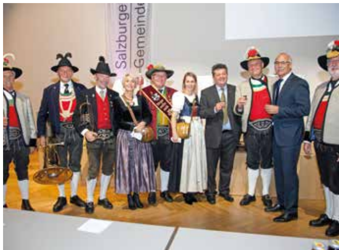
Die Präsidenten Schöpf und Mitterer im Kreis der Bürgermeistermusik.