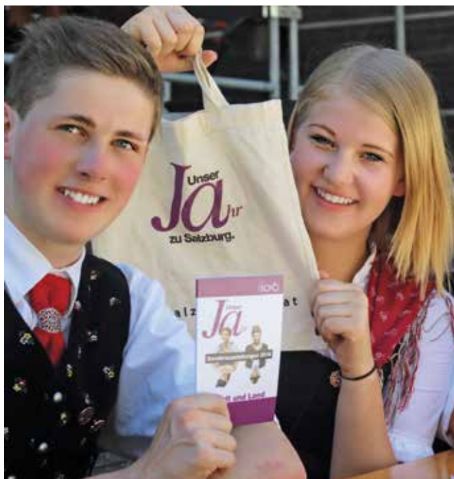
„Die Salzburg 20.16 Gemeinde bleibt weiterhin bestehen!“