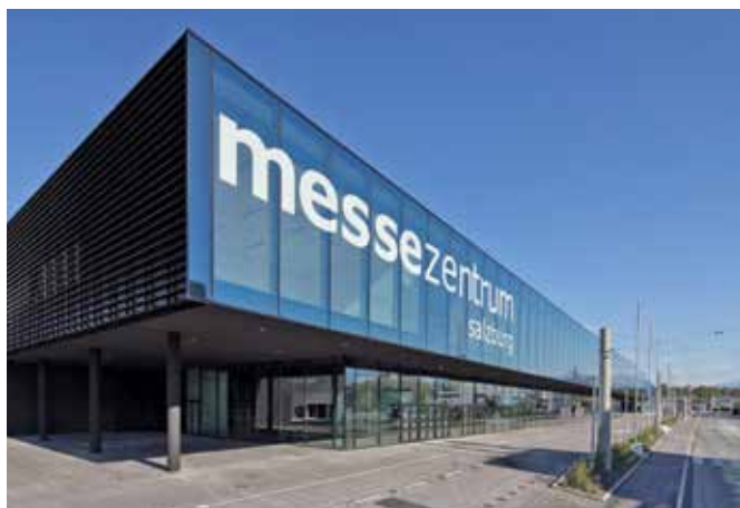
Messezentrum Salzburg

W er zuerst kommt, mahlt zuerst – nach diesem Prinzip ist bei frühen Anmeldungen die Auswahl an Hotels am größten. Der Österreichische Gemeindetag findet von 29. bis 30. Juni in Salzburg statt. Ihr Kommen zugesagt haben Bundespräsident Alexander Van der Bellen, Ministerin Sonja Hammerschmid und Minister Andrä Rupprechter.