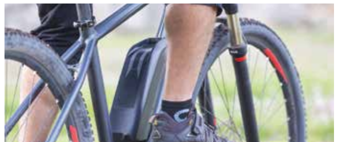
Salzburger Radjahr 2017