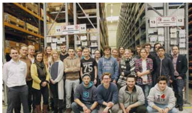
Die Studierenden der Universität Salzburg bei der Firma Alpen-Maykestag GmbH in Puch bei Salzburg.

Die EuRegio-Industrieeckursion in Zusammenarbeit mit der Wirtschaftsförderungsgesellschaft Berchtesgadener Land und der Industriellenvereinigung Salzburg führte am 7. Februar 2017 25 Studierende des Studiengangs Ingenieurwissenschaften der Universität Salzburg zu zwei Vorzeigebetrieben in der EuRegio.