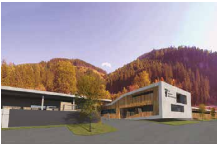
Bad Gastein: Bau- und Recyclinghof Architekt – Vandalps Architecture Ziviltechniker GmbH

Die Salzburg Wohnbau ist im Bundesland Salzburg Marktführer im Kommunalbau-Bereich. Seit vielen Jahren vertrauen Gemeinden dem innovativen Unternehmen die Ausschreibungen, Planungen und Bauabwicklungen von Schulen, Seniorenheimen, Kindergärten oder Feuerwehrhäusern an. Durch die jahrelange Erfahrung bietet die Salzburg Wohnbau großes Know-how, fundierte Kompetenz gepaart mit Zuverlässigkeit und Qualität in den einzelnen Geschäftsfeldern. Egal ob große oder kleine Projekte, die Ausschreibungen dazu werden immer komplexer. Deshalb wird es für Gemeinden immer wichtiger, einen kompetenten Partner an ihrer Seite zu haben, der sie bei der Durchführung von Vergabeverfahren und Architekturwettbewerben in allen Phasen verantwortungsvoll begleitet.