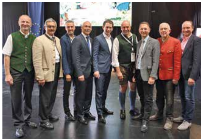
Salzburger Bürgermeister mit Außenminister Sebastian Kurz.

Am Freitag, dem 30. Juni 2017, ist der 64. Österreichische Gemeindetag in der Landeshauptstadt Salzburg zu Ende gegangen. In den vorhergehenden Tagen zeigten die Österreichischen Gemeinden Stärke, Selbstbewusstsein und Geschlossenheit. Nicht nur die Zahl der Besucherinnen und Besucher aus allen Landesteilen, sondern auch die der höchstrangigen Vertreter aus Wirtschaft, Gesellschaft und Politik erreichte Rekordwerte.