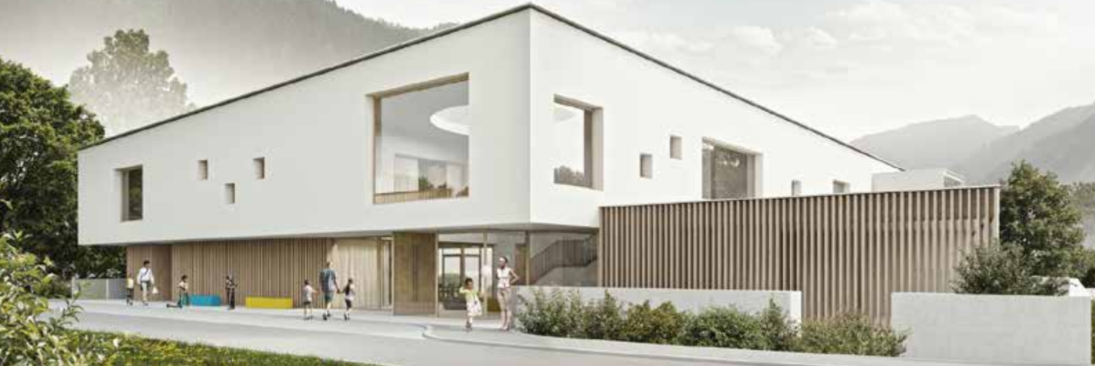
Grossarl: Kinderbetreuungseinrichtung und Betreutes Wohnen, Architekt – thalmeier architektur ZT GmbH