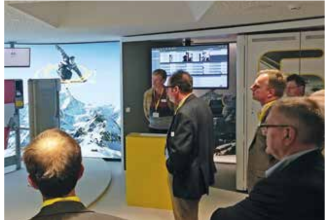
Höhepunkt des EuRegio-Dialogs bei SKIDATA in Grödig war die Führung durch die neu geschaffene Erlebniswelt.

Der erste EuRegio-Dialog 2017 führte am 1. Juni 2017 zur SKIDATA AG nach Grödig. SKIDATA ist ein führendes Unternehmen im Bereich Zutrittslösungen. Weltweit sorgen mehr als 10.000 SKIDATA-Installationen in Skigebieten, Stadien, Flughäfen, Einkaufszentren, Städten, Spa & Wellnessbetrieben, Messen und Freizeitparks in 100 Ländern für die zuverlässige Zutritts- bzw. Zufahrtskontrolle von Personen und Fahrzeugen. Die Lösungen von SKIDATA, die intuitiv, einfach zu bedienen und sicher sein sollen, tragen zur Leistungsoptimierung und Gewinnmaximierung der Kunden bei. Die Gäste hatten die Möglichkeit, diese Produkte in der neuen Erlebniswelt kennenzulernen. Auch das Innovationskonzept wurde vorgestellt, bei dem Ideen und Vorschläge der Belegschaft aufgegriffen werden.