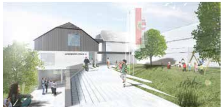
Lessach: Gemeindeganzentrum mit Multifunktionsraum Architekt – studio WG3 ZT GmbH

Aktuell zeichnet die Salzburg Wohnbau für das Projektmanagement und den Architekturwettbewerb rund um den Neubau des Bau- und Recyclinghof in Bad Gastein verantwortlich. Dabei ging das ortsansässige Architekturbüro „Vandalps architecture“ als Sieger hervor. Die Gemeinde Grossarl hat die Salzburg Wohnbau-Experten mit der Projektabwicklung für eine neue Kinderbetreuungseinrichtung und einen Bau für Betreutes Wohnen beauftragt. In Rauris steht die Salzburg Wohnbau der Gemeinde als kompetenter Partner bei der Planung eines Projekts zu Seite, das sowohl ein Seniorenwohnheim, eine Kinderbetreuungseinrichtung, eine Rot-Kreuz Dienststelle, eine Dojo-Halle als auch Betreutes Wohnen unter einem Dach vereinen wird.