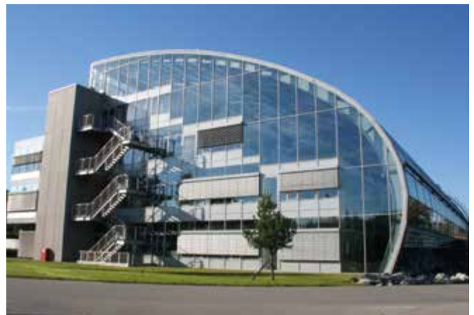
Blickfang im AlzChem-Chemiepark in Trostberg – das Forschungs- und Entwicklungszentrum der BASF Construction Solutions GmbH.

Der erste EuRegio-Dialog 2017 führte am 1. Juni 2017 zur SKIDATA AG nach Grödig. SKIDATA ist ein führendes Unternehmen im Bereich Zutrittslösungen. Weltweit sorgen mehr als 10.000 SKIDATA-Installationen in Skigebieten, Stadien, Flughäfen, Einkaufszentren, Städten, Spa & Wellnessbetrieben, Messen und Freizeitparks in 100 Ländern für die zuverlässige Zutritts- bzw. Zufahrtskontrolle von Personen und Fahrzeugen. Die Lösungen von SKIDATA, die intuitiv, einfach zu bedienen und sicher sein sollen, tragen zur Leistungsoptimierung und Gewinnmaximierung der Kunden bei. Die Gäste hatten die Möglichkeit, diese Produkte in der neuen Erlebniswelt kennenzulernen. Auch das Innovationskonzept wurde vorgestellt, bei dem Ideen und Vorschläge der Belegschaft aufgegriffen werden.