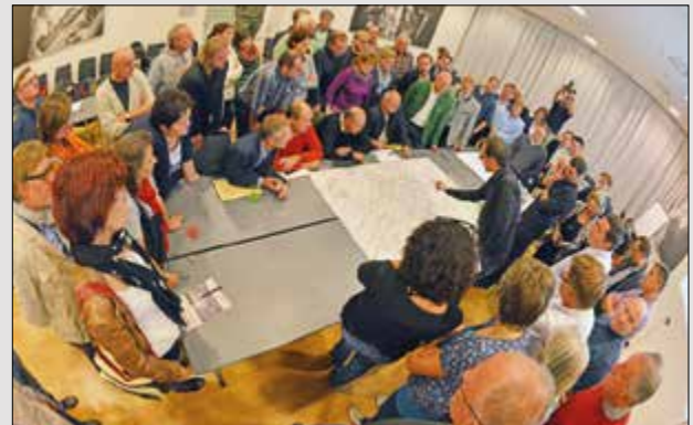
Großer Andrang herrschte bei der Abschlusspräsentation in Saalfelden am Steinernen Meer.

Mit der Stärkung der Ortskerne sind auch eine Reihe weiterer Handlungsansätze verbunden. So sollten die Ortskernabgrenzungen überdacht und ein Weiterbildungsprogramm für PlanerInnen und EntscheidungsträgerInnen entwickelt werden, um das Bewusstsein für diese Thematik zu schärfen. Auch mit dem österreichischen Baukulturbeirat soll dieses Thema österreichweit diskutiert und Lösungen erarbeitet werden.