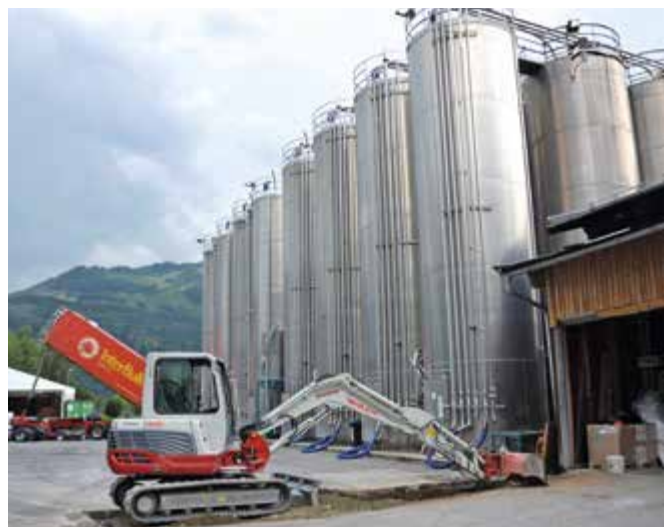
40 Silos für die Aufnahme der Rohstoffe stehen am Beginn des Produktionsprozesses bei Senoplast in Piesendorf.

und Mörtel und Produkte für die Anwendung bei der Erdöl- und Erdgasgewinnung werden produziert. Beim Betriebsrundgang konnten die Gäste das BASF Forschungs- und Entwicklungszentrum besichtigen, das sowohl optisch als auch von der Grundkonzeption ein Highlight darstellt. Auch wurden in den Labors Entwicklungsprozesse erläutert.