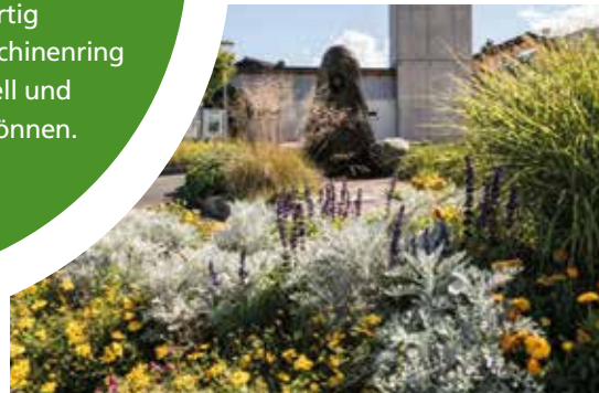
Saisonbepflanzung Maishofen .