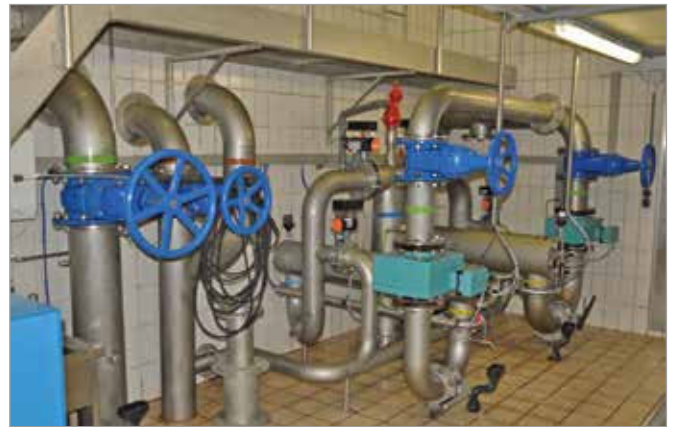
WVA Zell am See-Bruck