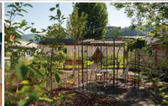
Seniorenwohnheim, Nahversorger mit Café und Wohnungen in einem Objekt – zentral gelegen nahe dem Ortszentrum von Golling.