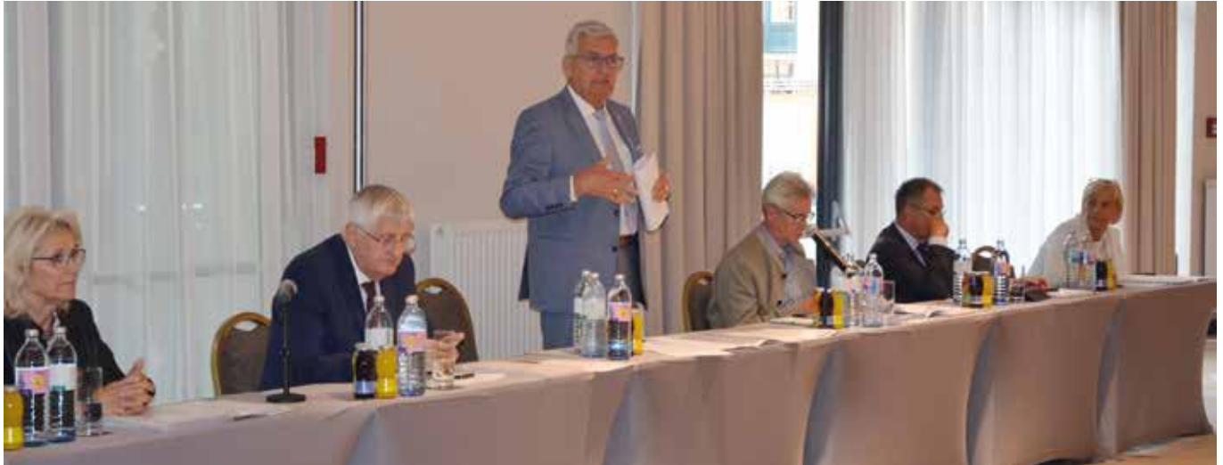
Präsident und VizepräsidentInnen des Österreichischen Gemeindebundes in Innsbruck, Bild: Österreichischer Gemeindebund

Weiterhin herausfordernde Situation für die österreichischen Gemeinden – Zwei Resolutionen an den Bund beschlossen