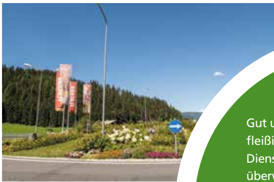
Kreisverkehr Flachau - Gestaltung und regelmäßige Pflegemaßnahmen.