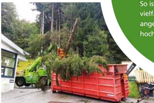
Baumabtragungen Kaprun . Mittels hochmodernem Fällkran können Baumabtragungen in sensiblen Wohngebieten sicher und rasch durchgeführt werden.

So ist es zu erklären, dass derartig vielfältige Aufgaben vom Maschinenring angenommen und professionell und hochwertig erledigt werden können.