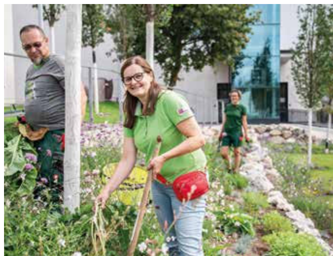
Ökologisch wertvolle Grünräume gestalten – und gleichzeitig regionale Arbeitsplätze sichern: Das verwirklicht der Maschinenring Salzburg mit seinem Leistungsangebot.

Die Grünraum-Experten des Maschinenring sind Ansprechpartner, wenn es darum geht, nachhaltige Naturoasen zu schaffen. Biologische Vielfalt, regionale Pflanzen, alte Kultursorten und möglichst wenig Eingriff in die Natur – so entsteht ein stimmiges Ganzes zum Wohle und Schutz der Natur und als Wohlfühlorten im öffentlichen Raum, die Auge und Seele guttun.