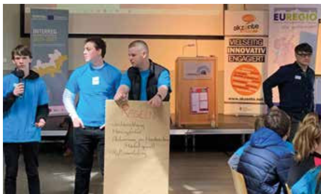
Die Sprecher der Salzburger und bayerischen Jugendlichen der blauen Gruppe präsentieren die Regeln ihres Staates.

das interaktive Planspiel „Newland“ im Lokschuppen Freilassing. „Newland“ ergänzt den theoretischen Unterricht für politische Bildung. Die Schüler/innen können dabei in einem vereinfachten Modell in einem geschützten Rahmen experimentieren, Meinungen bilden und beeinflussen, Verantwortung und Macht übernehmen oder abgeben, Mehrheiten finden, abweichende Meinungen erleben und tolerieren lernen und Rollen finden, in denen sie ihre Gemeinschaft mitgestalten. Die Schüler/innen schlossen sich zu sechs verschiedenen „Nationen“ zusammen und bekamen „Gebiete“ zugewiesen. In sechs Runden wurde dann eine Staatsgründung durchgespielt. Die Teilnehmer/innen mussten Flaggen entwerfen, Hymnen schreiben und sich Gesetze bzw. Regeln geben. Durch Austesten und Abbildung werden den Jugendlichen so Entscheidungsprozesse und politische Abläufe nähergebracht.