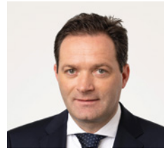
Norbert Totschnig Bundesminister für Land- und Forstwirtschaft, Regionen und Wasserwirtschaft

” Hinter dem einzigartigen Urlaubserlebnis in Österreichs Bergen stecken die harte und traditionsreiche Arbeit unserer Almbäuerinnen und Almbauern. Zehn klare Verhaltensregeln erhöhen die Sicherheit und helfen Konflikte zu vermeiden. Unser Ziel ist es, dass die Bäuerinnen und Bauern ihren Tätigkeiten nachgehen, bzw. die Gäste sich wohlfühlen können. “