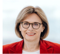
Susanne Kraus-Winkler Staatssekretärin für Tourismus

” Der Tourismus zählt zu den zentralen Stützen der heimischen Wirtschaft. Die traditionelle Gastfreundschaft, hervorragende Kulinarik und einzigartige Natur sind besondere Alleinstellungsmerkmale der Urlaubsdestination Österreich. Die Verhaltensregeln auf Almen und Weiden leisten einen wichtigen Beitrag, damit dies auch in Zukunft so bleibt. “