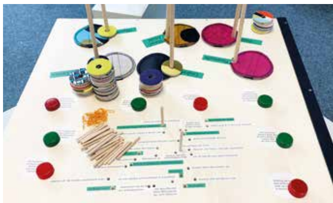
Die interaktive Wanderausstellung „Klimaladen – was hat mein Konsum mit dem Klima zu tun?“ kann kostenfrei von Schulen und Institutionen in der EUREGIO gebucht werden.