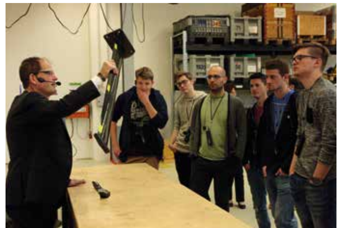
Ein neuer Geschäftszweig von Geislinger: Unter dem Namen Levitaz werden Foils für Kite-Surfer hergestellt.

Im Rahmen der EuRegio-Industrieexkursionen machten sich am 17.2.2016 zwanzig Studentinnen und Studenten der Ingenieurwissenschaften bei den Salzburger Leitbetrieben Geislinger (Hallwang) und Leube (Grödig) selbst ein Bild, wie ihre zukünftige berufliche Tätigkeit aussehen könnte.