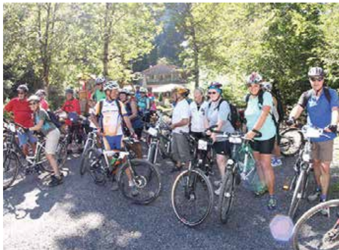
Die Teilnehmer/-innen der 1. EuRegio-Genuss-Radtour