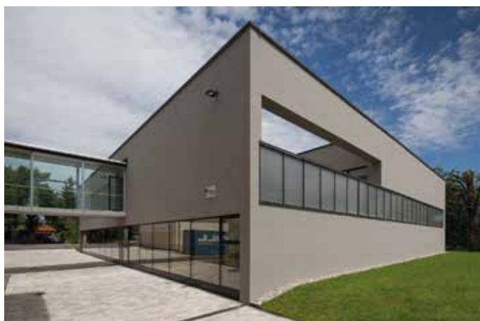
Neue HAK-Turnhalle in Neumarkt