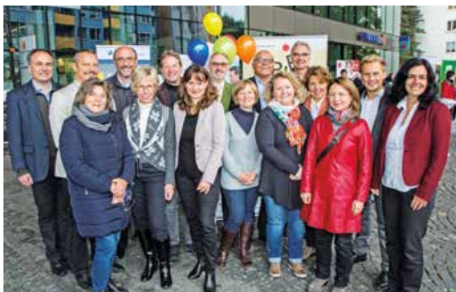
Die Vertreter/-innen der teilnehmenden Einrichtungen mit Landesrätin Martina Berthold (1. Reihe, 3. v. li.) und Gabriele Pursch von der EuRegio (1. Reihe, 2. v. li.).