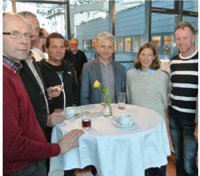
ANKÖ Treff Vergabe, Bild: ANKÖ

Als Auftaktveranstaltung der Kooperation mit Kommunalnet und der Auftragnehmerkataster Österreich (ANKÖ) gemeinsam mit dem Salzburger Gemeindeverband zum Vergabetreff nach St. Johann im Pongau. Dabei wurde den geladenen Gemeindevertretern ein dichtes und informatives Programm geboten, bevor sich die Gäste im gemütlichen Rahmen über ihre Erfahrungen mit der e-Vergabe austauschen konnten.