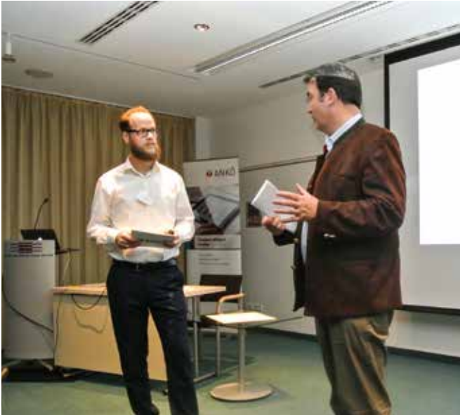
ANKÖ Treff Vergabe