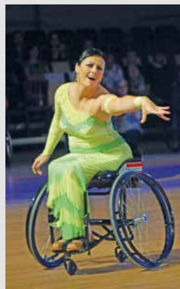
Sanja Vukasinovic, Vize-Europameisterin im Freestyle Bronzemedaille in Single Women

Sanja Vukasinovic wird das Jahr 2016 als weltbeste Rollstuhlтанзlerin mit einer zweifachen Weltranglistenführung in ihren beiden Disziplinen beenden.