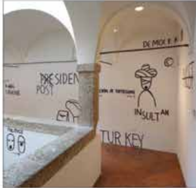
Ausstellungsansicht Bildwitz und Zeitkritik. Satire von Goya bis Grosz; Installation von Dan Perjovschi.