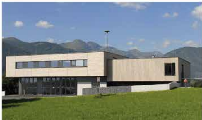
In St. Michael, im Ortsteil St. Martin wurde die moderne Einsatzzentrale errichtet.

Die Salzburg Wohnbau ist im Bundesland Salzburg absoluter Marktführer im Kommunalbaubereich und hat in den vergangenen Jahren bereits zahlreiche Feuerwehrhäuser in Salzburgs Gemeinden errichtet. Kürzlich wurde zwei weitere Einsatzzentralen in St. Michael und Bad Hofgastein offiziell eröffnet.