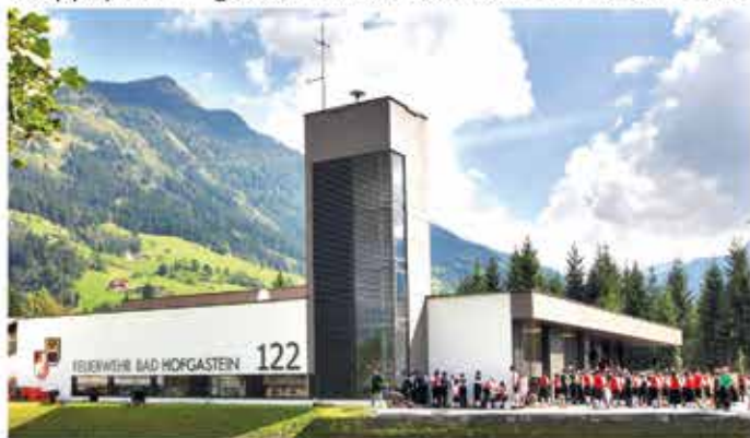
70 ehrenamtliche Helfer in Bad Gastein freuen sich über das neue Feuerwehrhaus.

ellen Anforderungen. Nach den Plänen des Salzburger Architekturbüros „berger.hofmann“ wurde das moderne Gebäude direkt an der Bundesstraße errichtet und ermöglicht schnelle und reibungslose Einsätze in Notfällen. Auf dem knapp 4000 m 2 großen Grundstück, das die Pfarre im Bau-