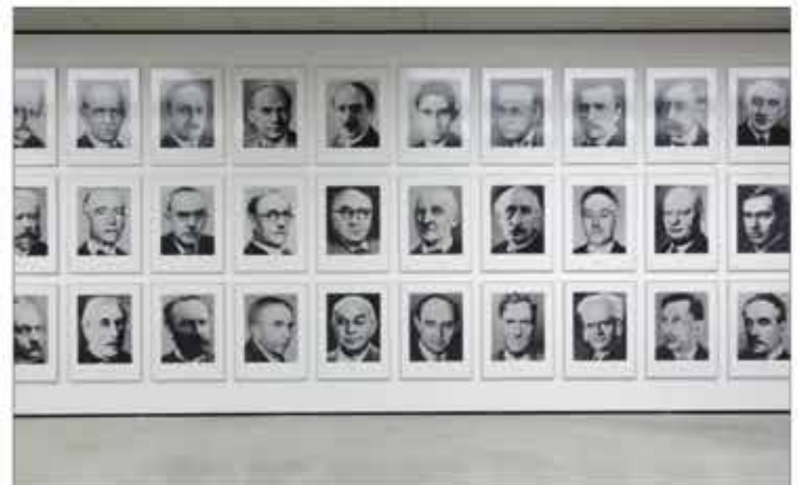
Gerhard Richter, 48 Portraits, 1972/2016, © Gerhard Richter Archiv, Staatliche Kunstsammlungen Dresden; Ausstellungsansicht Anti:modern , Salzburg inmitten von Europas zwischen Tradition und Erneuerung, © Museum der Moderne Salzburg

Im Museumsgebäude am Mönchsberg richtet die Ausstellung Anti:modern aus Anlass der zweihundertjährigen Zugehörigkeit Salzburgs zu Österreich Schlaglichter auf Ereignisse und Phänomene in dieser Stadt und Region inmitten eines Europas zwischen Tradition und Erneuerung. Historische Exponate aus bildender Kunst, Gesellschaft und Politik, Literatur, Tanz, Theater, Musik und Wissenschaft werden darin Arbeiten namhafter zeitgenössischer KünstlerInnen gegenübergestellt, darunter Alice Creischer/Andreas Siekmann, Renée Green, Hans Haacke, Oliver Ressler, Gerhard Richter, Isa Rosenberger und Franz West.