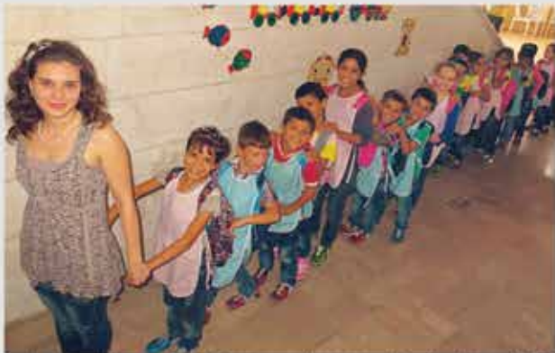
In der syrischen Küstenstadt Lattakia bekommen Kinder, die auf Grund von Krieg und Flucht nicht zur Schule gehen konnten, Förderunterricht und eine gesunde Jause.

Die Küstenstadt Lattakia an der syrischen Mittelmeerküste gilt nach wie vor als die sicherste Stadt Syriens. Rund 1,5 Millionen Syrer, aus vom Bürgerkrieg betroffenen Regionen, haben in der syrischen Küstenregion Zuflucht gefunden. Die Kinder haben durch Krieg und Flucht schon länger keine Schule mehr besucht. Viele sind mangelernährt. Die medizinische Versorgung ist unzureichend.