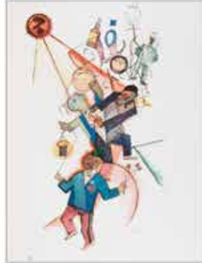
George Grosz, Johannisnacht, 1918. © Bildrecht Wien